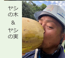
ヤシの木 & ヤシの実

パラオの交通状況は朝夕は通勤ラッシュとなり昼食時も交通量が多くなります。移動手段はほぼ車で、8割が中古の日本車（最近の物～30年前の車まで）なので懐かしく思います。天候は平均気温28℃位で日差しが強いので外工事の場合、サングラスをかけないと目が日焼けして充血してしまいます。天気が変わりやすく乾季にもかかわらずほぼ毎日雨が降ります。ただ、少し待っていれば止みますがその後めっちゃくちゃ暑くなります。